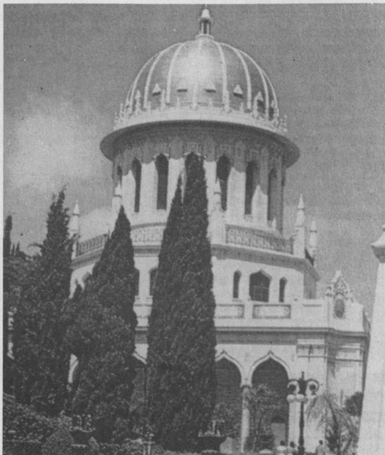
Baha'i-religionens helligdom på Karmelbjerget i Haifa.

Når jeg tænker på, hvad Israelsmission er for noget, er det klart, at Israelsmission har noget at gøre med Israel. Med jøder, der bor i Israel, men ikke kun i Israel. »Israel« er ikke kun en betegnelse for staten Israel, som i slutningen af april måned kunne fejre sin 45-års dag, men også for folket Israel, altså jøder i det hele taget, uanset hvor de befinder sig. Når man beskæftiger sig med Israelsmission, beskæftiger man sig med spørgsmålet om, hvordan man kan bringe det tilbage til det jødiske folk, som man selv har fået fra